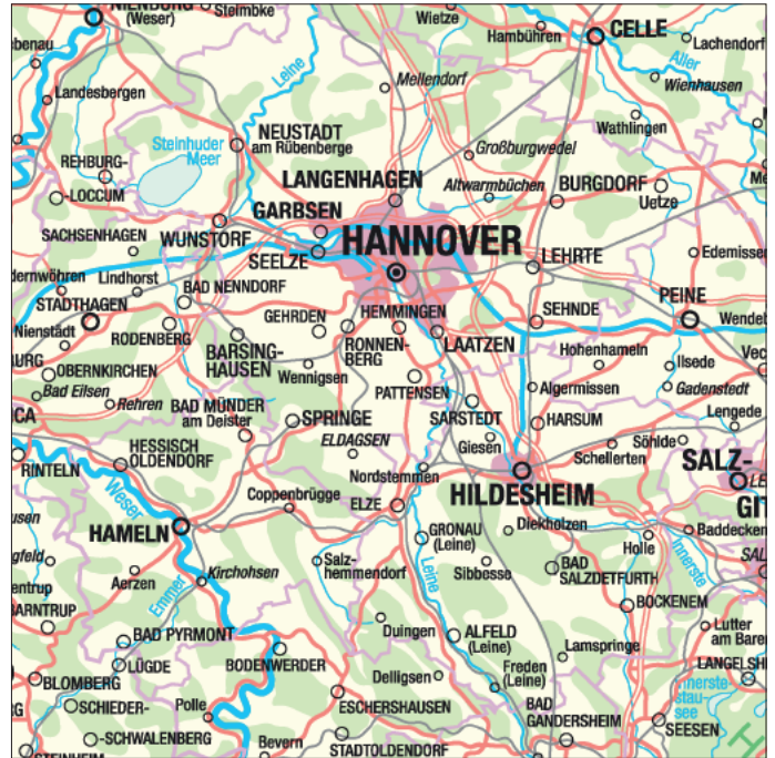
Ausschnitt der DÜKN1000, als Summenlayer, farbig, im Rasterdaten-Format