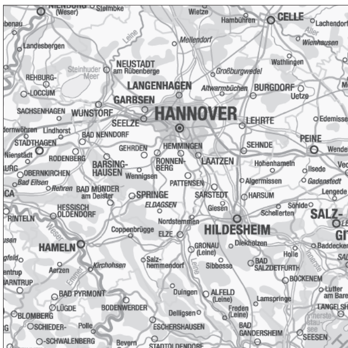
Ausschnitt der DÜKN1000, als Summenlayer in Graustufen, im Rasterdaten-Format

Größere Naturräume, Siedlungsflächen, Flüsse, Kanäle und Gewässerflächen sind mit Namen versehen. Sämtliche niedersächsische Kreise sind mit Verwaltungssitz verzeichnet. Die Größe der Ortsbeschriftung weist auf die Einwohnerzahl der Siedlungen hin.